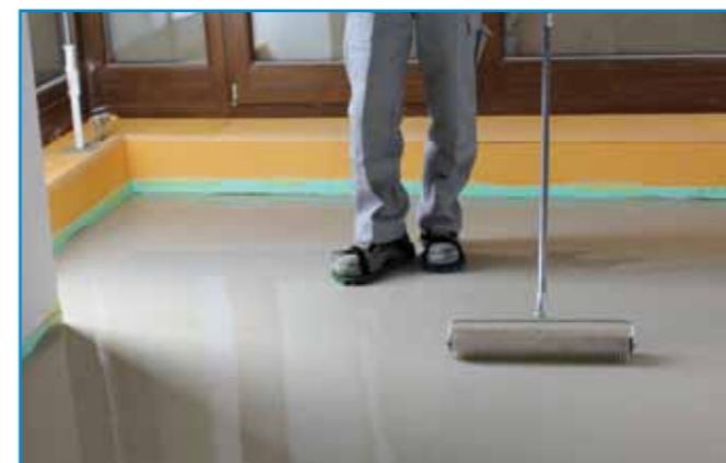
A frissen kiöntött aljzatkiegyenlítőt tuskéhengerrel kilevegőztetjük.