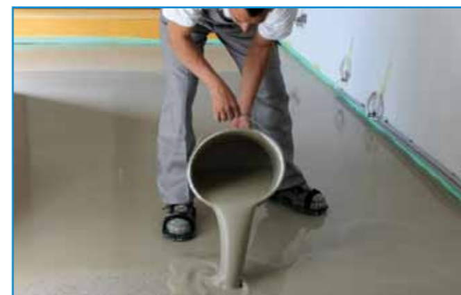
Pihentetés majd újrakeverés után azonnal öntjük ki a felületre.