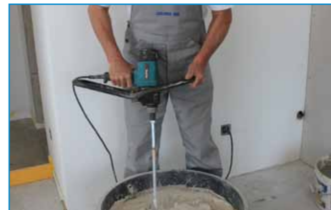
Az aljzatkiegyenlítőt lassú fordulatszámon működtetett keverőgéppel keverjük ki.

Szerszámok: rozsdamentes acél simító, tuskéhenger, kőműveskanál